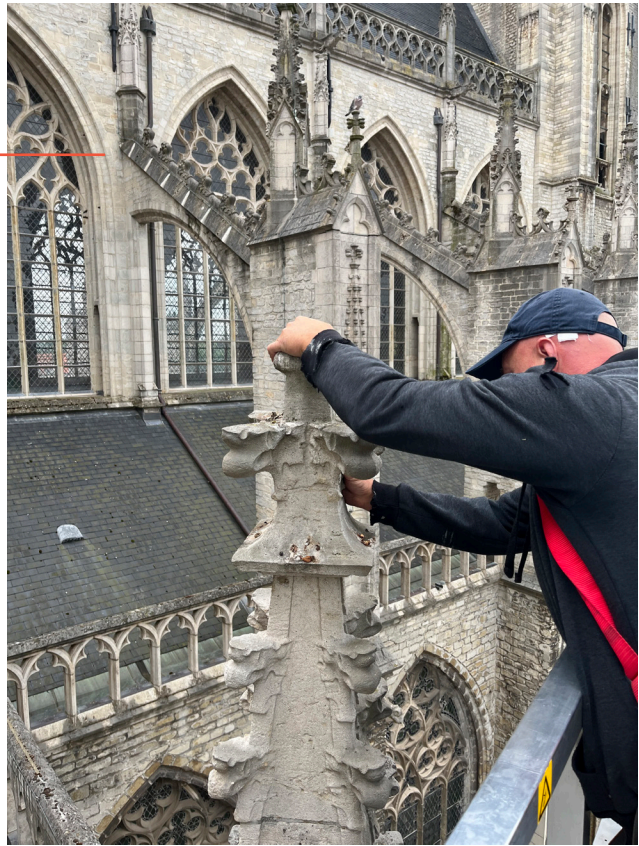
afname losse natuursteen

Begin juli werd een hoogwerker van 38 meter gebruikt om te controleren of er stukken steen waren die loszaten aan de zijbeuken en de westgevel van de kerk. Voor het dak en de stenen aan de toren werd een nog grotere