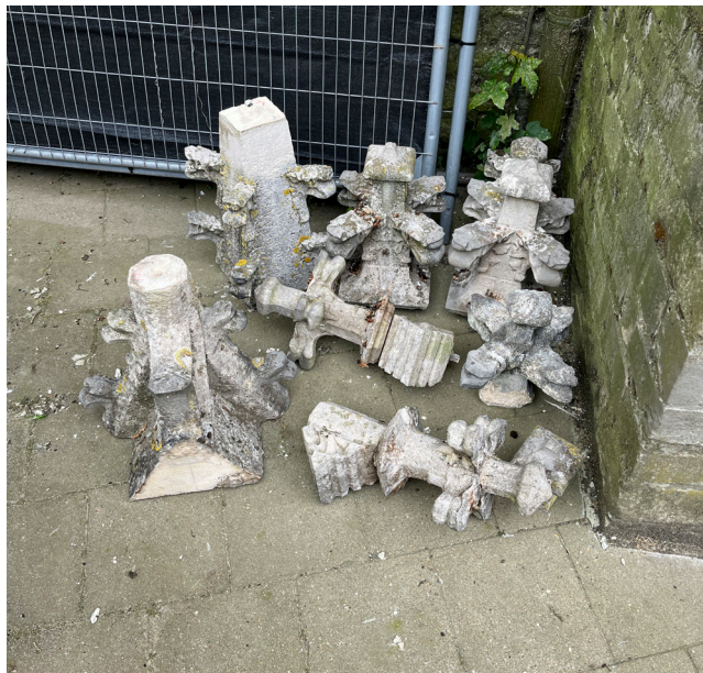
Losse natuurstenen delen

hoogwerker van 56 meter gebruikt. Zorgvuldig hebben ze de losse stukken stenen verwijderd en voorzien van labels, zodat ze eventueel in de volgende fase terug kunnen worden geplaatst met voldoende verankeringen.